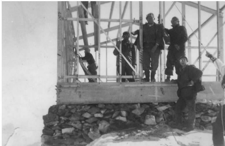
Refugio de Vallot. Mont Blanc_1938