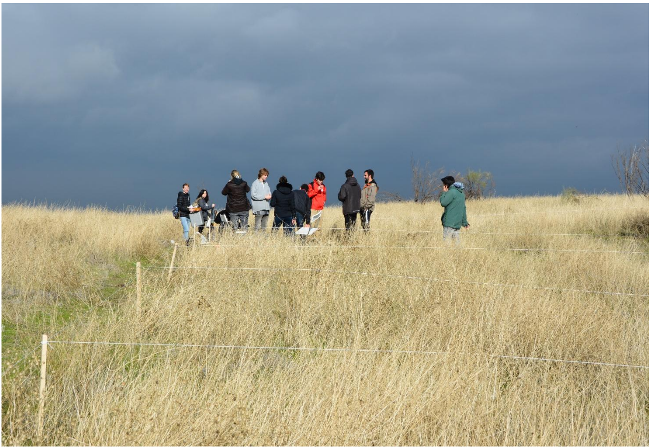
Fig.2. En el Cerro Almodóvar, Estudio Paisaje 2024.

La segunda fase es sintética y se desarrollará individualmente con sesiones semanales de taller para proponer los conceptos y las ideas matrices, que servirán como focos orientativos, guías o metas a seguir en las propuestas arquitectónicas.