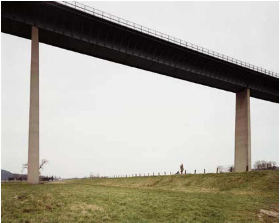
Ruhr Valley, Andreas Gursky 1989