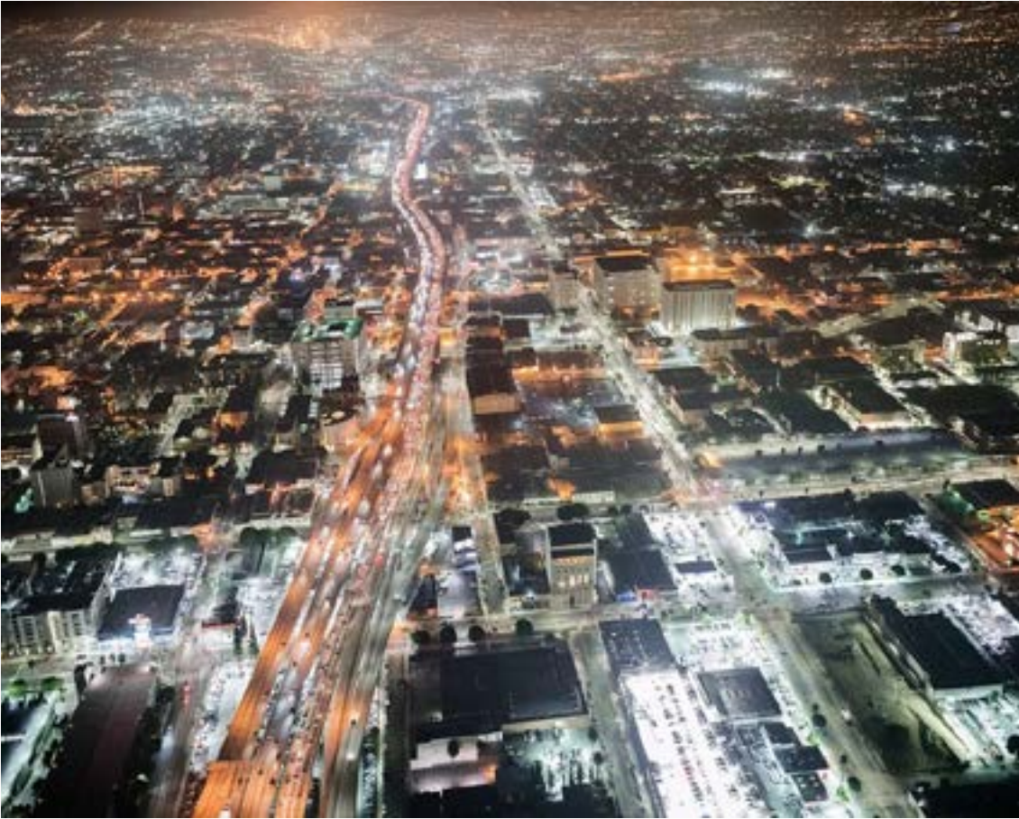
LA Night 08, Michael Light 2016