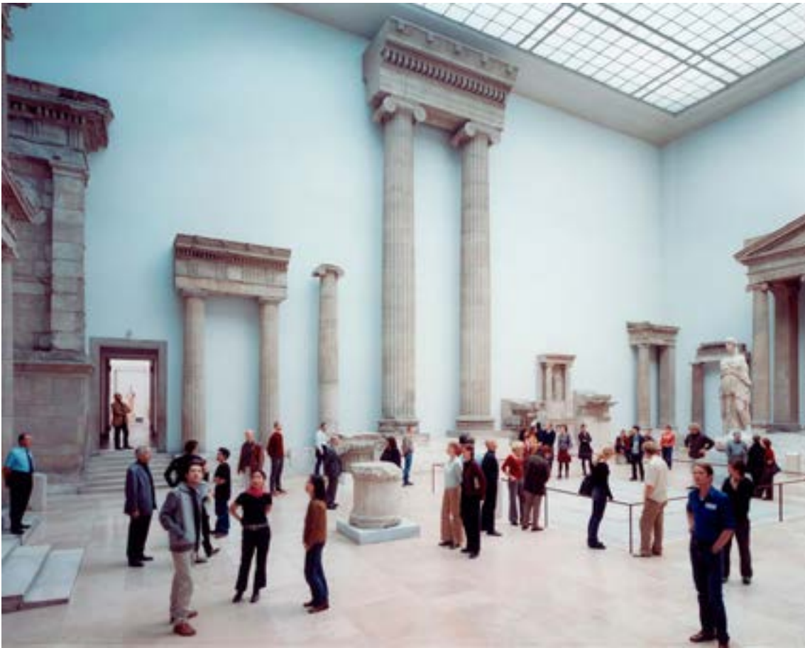
Pergamon Museum III, Thomas Struth 2001